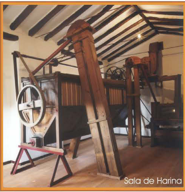
Sala de Harina