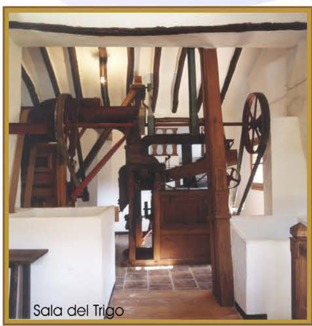
Sala del Trigo