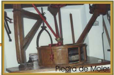
Piedra de Moler