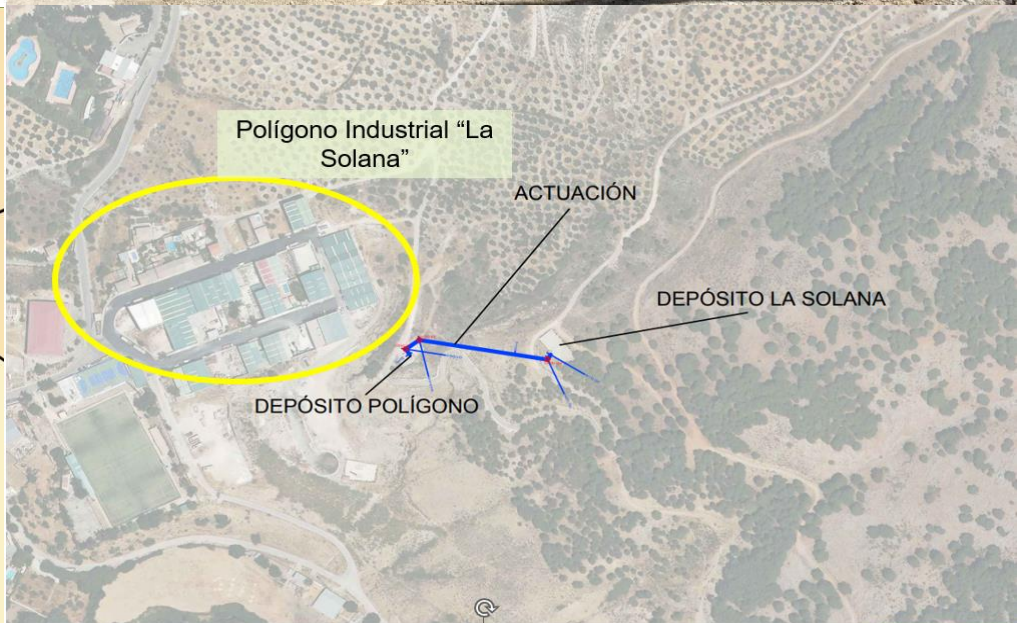
Mejoras en el Polígono Industrial "La Solana" en el T.M. Valdepeñas de Jaén